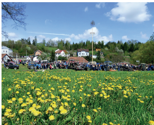
Traktoriáda - Nános - 7. května 2023