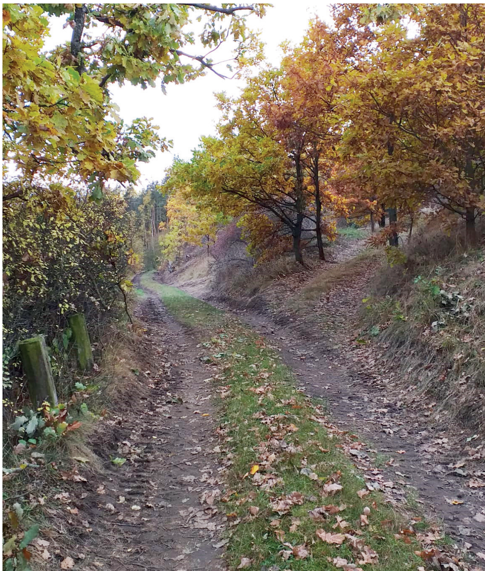
Fotobádanka z okolí