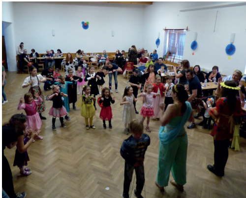
Karneval pro děti - 1. dubna 2023