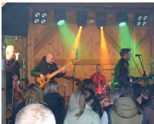
Traktoriáda - večer „na Vodárně“