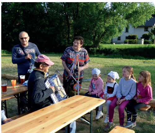
Kácení májky - 2. června 2023