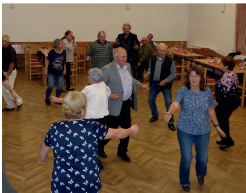
Setkání seniorů - 21. října 2023